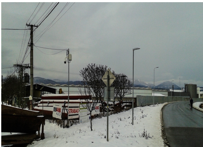
Osvetlenie smer Slávnica