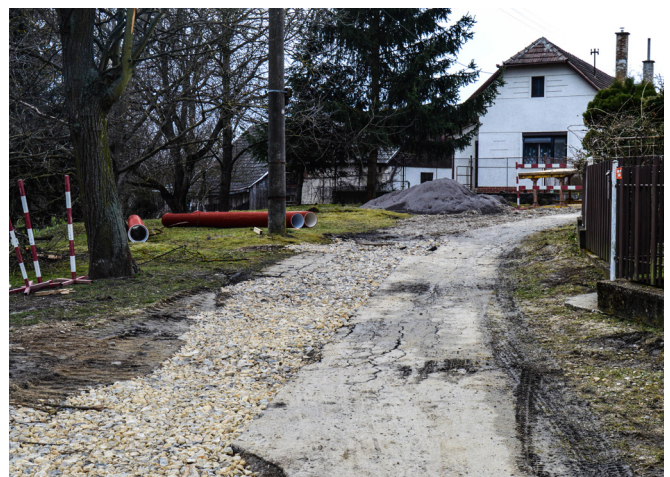
Kanalizácia v obci