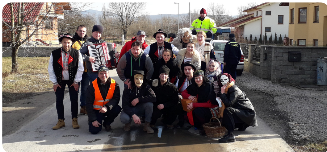
- spomienka na Fašiangy 2020